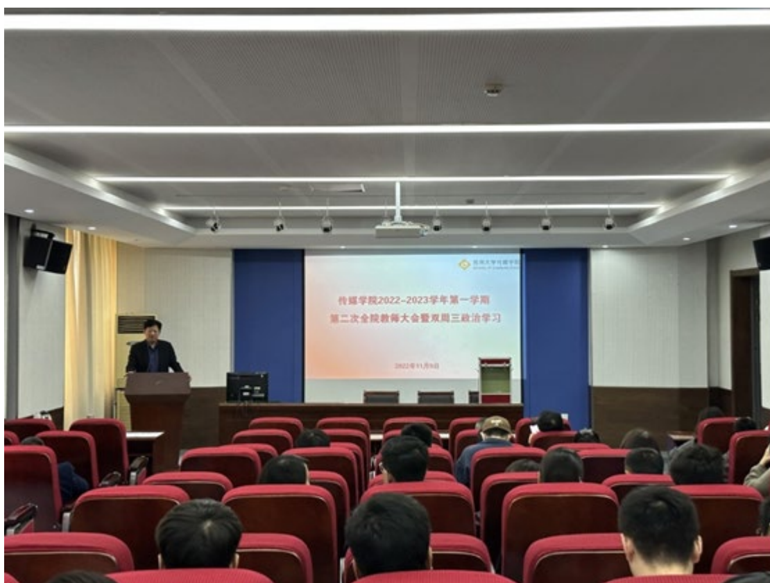
召开第二次全院教师大会暨双周三政治学习

(3) 加强师德监督。主要采用党委监督、支部监督、学生监督、同事监督等形式，发现问题及时反馈。