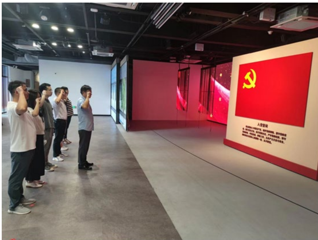
学院教工第三党支部前往中共苏州独立支部旧址进行参观学习