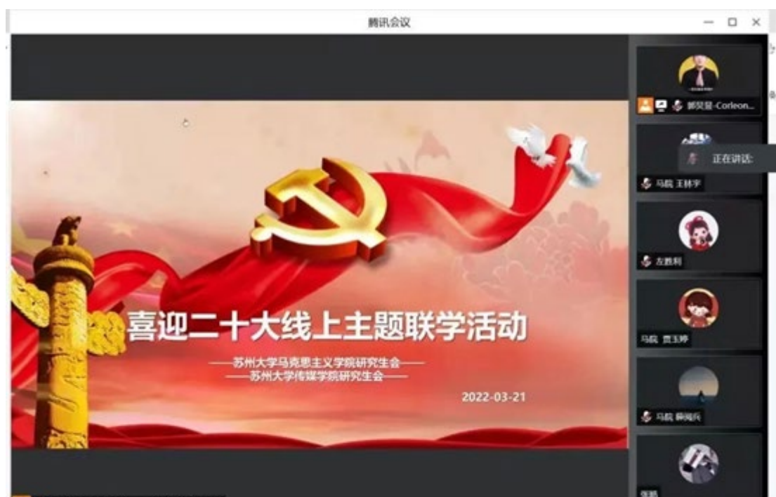
传媒学院与马克思主义学院联合举办“喜迎二十大”主题在线学习活动